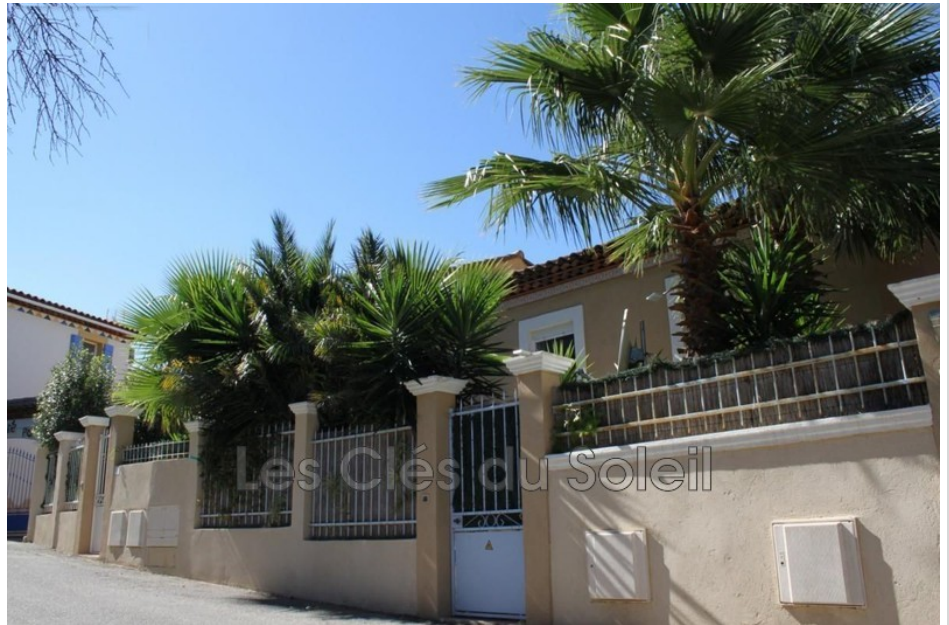
Villa 11895 Hyères

Les clés du soleil vous propose cette villa contemporaine idéalement située sur les hauteurs de COSTEBELLE au plus grand calme, mais proche des commodités et de la gare, vous rentrez par un petit jardin intimiste et verdoyant bénéficiant d'une piscine Hors sol, au RDC grande pièce de vie ouvrant sur une cuisine US aménagée et équipée, un WC ainsi qu'un espace buanderie-rangement. À l'étage 3 chambres, une grande salle de bain avec baignoire d'angle et un second WC. Et enfin vous bénéficiez d'une place de parking privative et d'une cave ! À voir absolument !!! 04 94 00 77 77